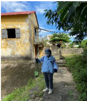
Hình 4: Trạm bơm Bích Bắc