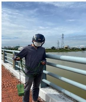
Hình 1: Cầu Hoà Xuân

Một số hình ảnh lấy mẫu hiện trường ngày 24/8/2022 tại các vị trí quan trắc: