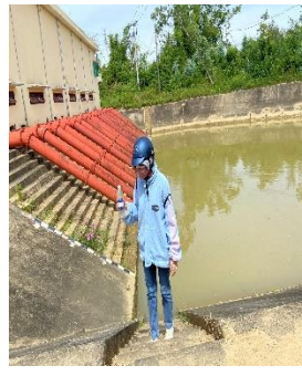
Hình 5: Trạm bơm Đông Quang