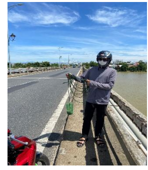
Hình 6: Cầu Câu Lâu