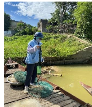
Hình 3: Trạm bơm Tuý Loan