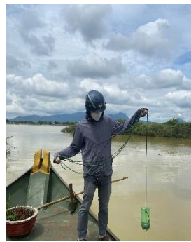
Hình 2: Vòm Cẩm Đồng