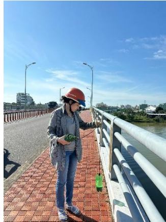
Hình 2. Cầu Hòa Xuân