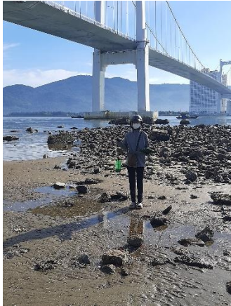
Hình 1. Cầu Thuận Phước

Một số hình ảnh lấy mẫu hiện trường ngày 14/08/2024 tại các vị trí quan trắc: