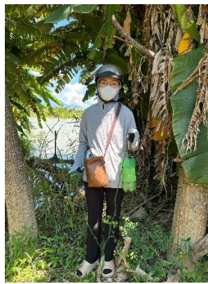
Hình 5. Trạm bơm Miếu Ông