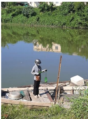
Hình 4. Trạm bơm Túy Loan