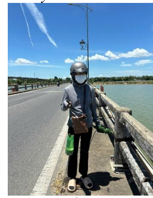
Hình 6. Cầu Câu Lâu