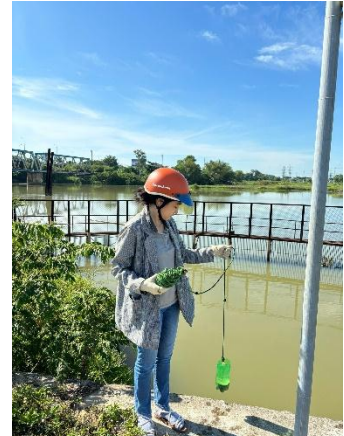
Hình 3. Thượng lưu nhà máy nước Cầu Đỏ