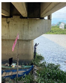
Hình 2: Cầu Hoà Xuân