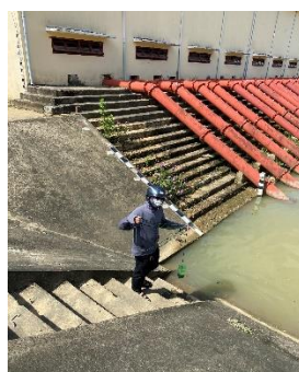
Hình 5: Trạm bơm Đông Quang