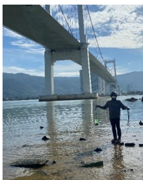
Hình 1: Cầu Thuận Phước

Một số hình ảnh lấy mẫu hiện trường ngày 17/8/2022 tại các vị trí quan trắc: