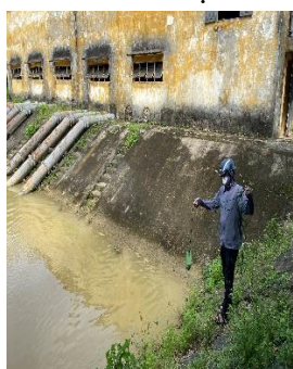
Hình 4: Trạm bơm Bích Bắc