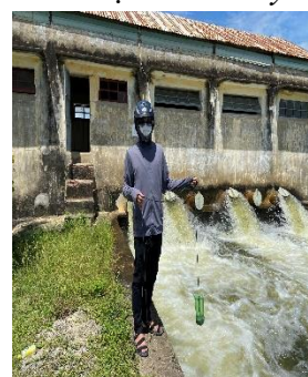
Hình 6: Trạm bơm Từ Cầu