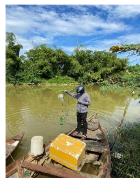
Hình 3: Trạm bơm Tuý Loan