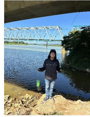
Hình 3. Thượng lưu nhà máy nước Cầu Đỏ