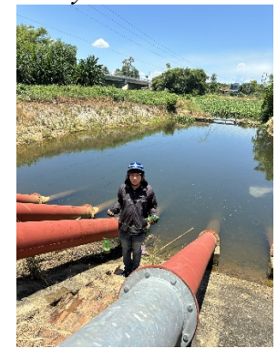
Hình 6. Trạm bơm Tứ Cầu