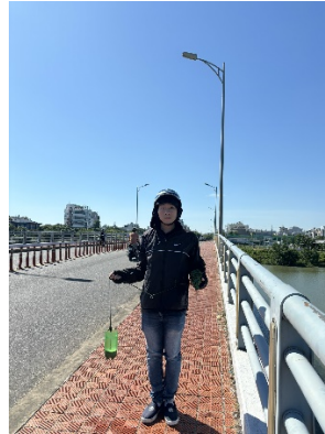
Hình 2. Cầu Hòa Xuân