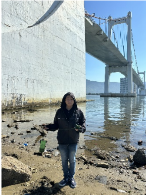
Hình 1. Cầu Thuận Phước

Một số hình ảnh lấy mẫu hiện trường ngày 07/08/2024 tại các vị trí quan trắc: