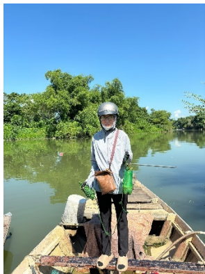
Hình 4. Trạm bơm Tủy Loan