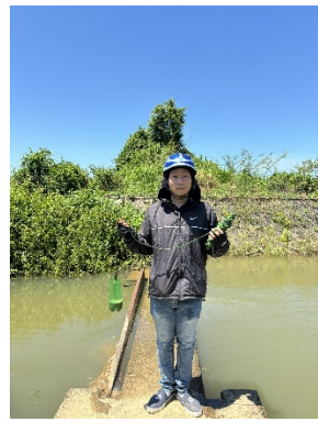
Hình 5. Trạm bơm Bích Bắc