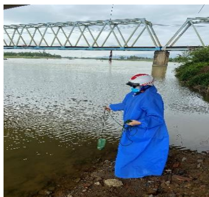
Hình 2: Thượng lưu Cầu Đỏ