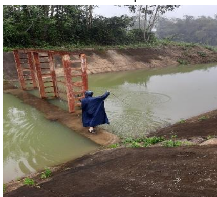
Hình 4: Trạm bơm Đông Quang