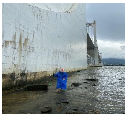
Hình 1: Cầu Thuận Phước

Một số hình ảnh lấy mẫu hiện trường ngày 10/8/2022 tại các vị trí quan trắc: