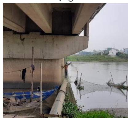
Hình 5: Cầu Hoà Xuân