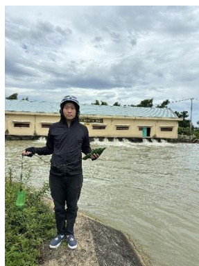
Hình 5. Trạm bơm Đông Quang