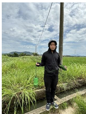
Hình 4. Trạm bơm Miếu Ông