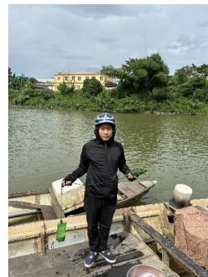
Hình 3. Trạm bơm Túy Loan