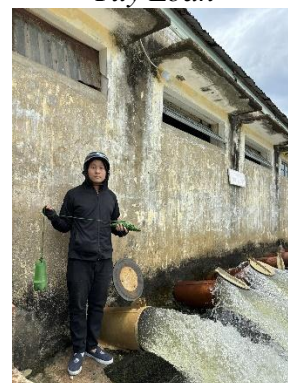
Hình 6. Trạm bơm Tứ Cầu