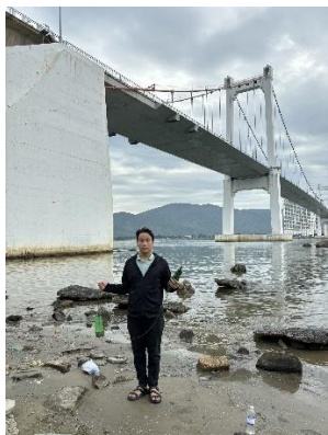
Hình 1. Cầu Thuận Phước

Một số hình ảnh lấy mẫu hiện trường ngày 31/07/2024 tại các vị trí quan trắc: