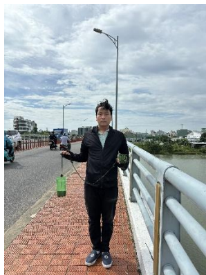
Hình 2. Cầu Hòa Xuân