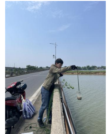
Hình 6. Cầu Câu Lâu