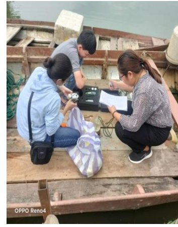
Hình 3. Trạm bơm Túy Loan