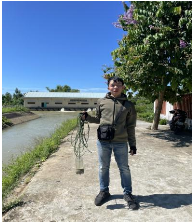
Hình 4. Trạm bơm Đông Quang