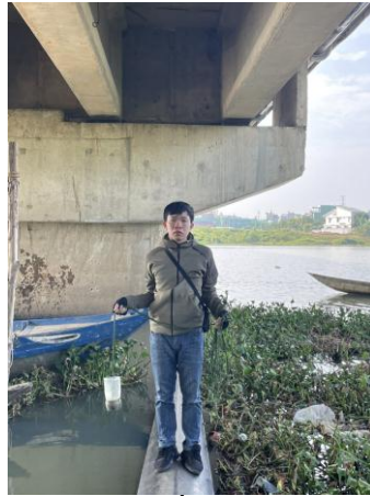
Hình 2. Cầu Hòa Xuân