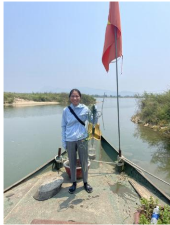
Hình 5. Vòm Cẩm Đồng