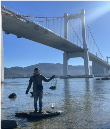
Hình 1. Cầu Thuận Phước

Một số hình ảnh lấy mẫu hiện trường ngày 26/07/2023 tại các vị trí quan trắc: