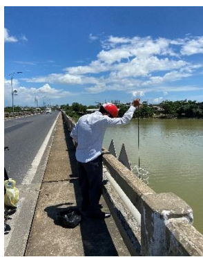
Hình 2: Cầu Câu Lâu