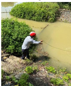
Hình 4: Trạm bơm Bích Bắc