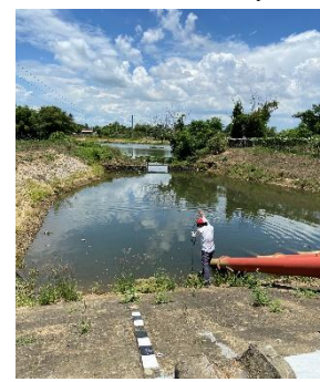
Hình 6: Trạm bơm Tứ Cầu