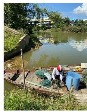
Hình 3: Trạm bơm Túy Loan