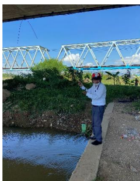
Hình 1: Thượng lưu Cầu Đỏ

Một số hình ảnh lấy mẫu hiện trường ngày 03/8/2022 tại các vị trí quan trắc: