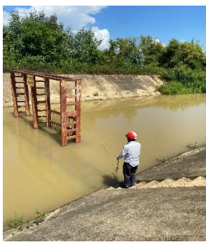
Hình 5: Trạm bơm Đông Quang