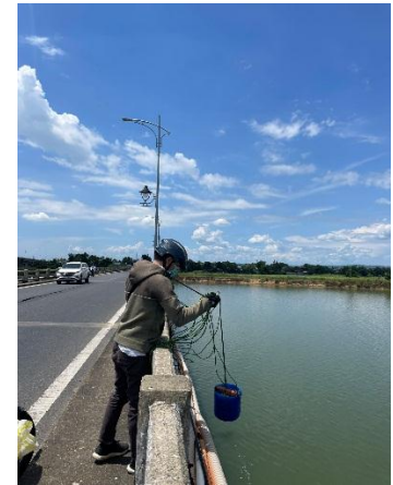
Hình 6. Cầu Câu Lâu