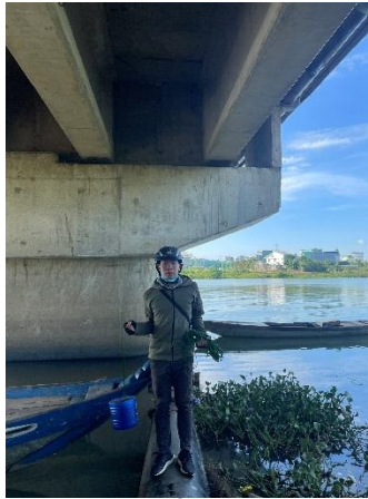
Hình 2. Cầu Hòa Xuân