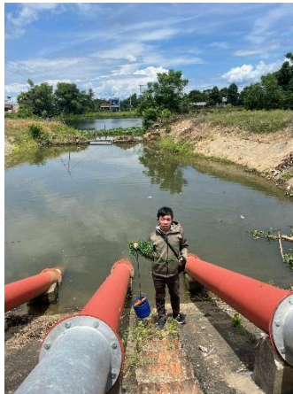
Hình 5. Trạm bơm Từ Cầu