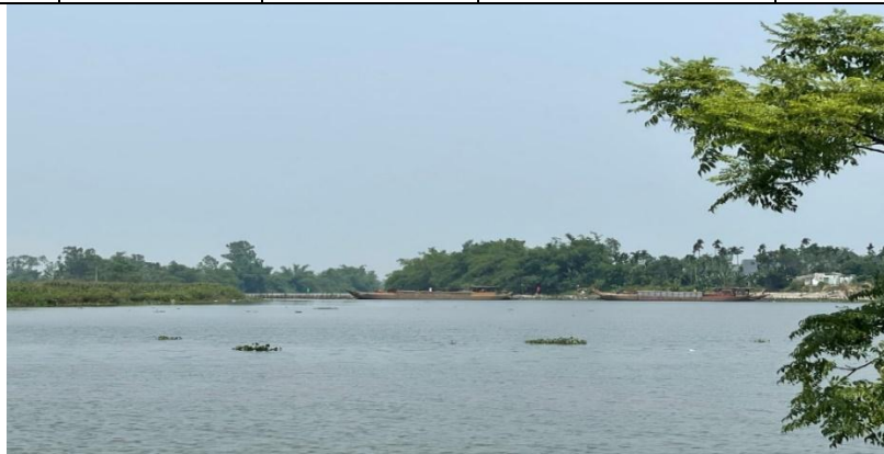
Hình 7. Công trình đập tạm Tứ Câu đã hoàn thiện