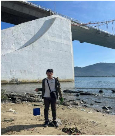
Hình 1. Cầu Thuận Phước

Một số hình ảnh lấy mẫu hiện trường ngày 19/07/2023 tại các vị trí quan trắc: