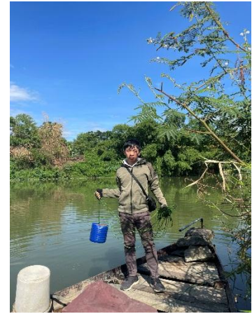
Hình 3. Trạm bơm Túy Loan