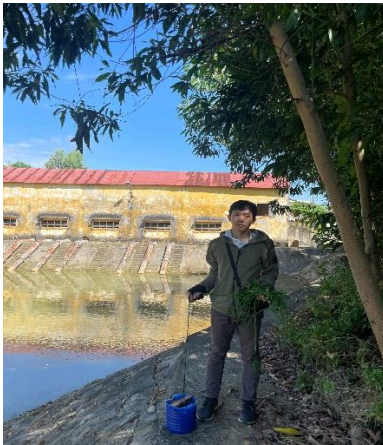
Hình 4. Trạm bơm Bích Bắc