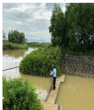
Hình 4: Trạm bơm Bích Bắc