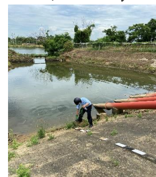
Hình 6: Trạm bơm Tứ Cầu