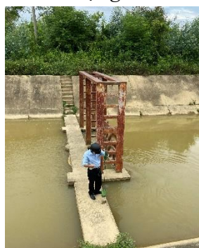
Hình 5: Trạm bơm Đông Quang