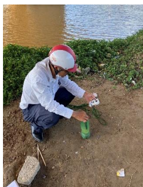
Hình 2: Thượng lưu Cầu Đỏ