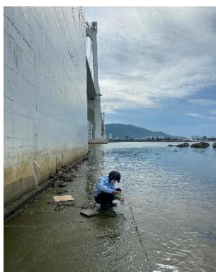
Hình 1: Cầu Thuận Phước

Một số hình ảnh lấy mẫu hiện trường ngày 20/7/2022 tại các vị trí quan trắc: