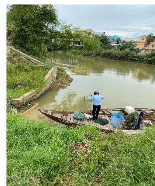
Hình 3: Trạm bơm Túy Loan