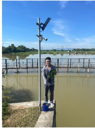
Hình 2. Thương lưu NMN Cầu Đỏ