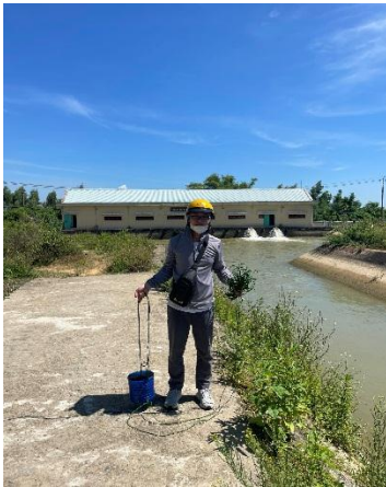
Hình 4. Trạm bơm Đông Quang