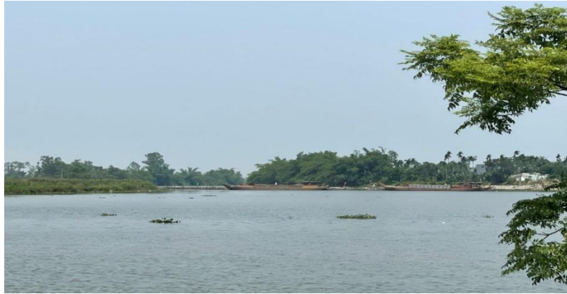
Hình 7. Công trình đập tạm Tứ Câu đã hoàn thiện