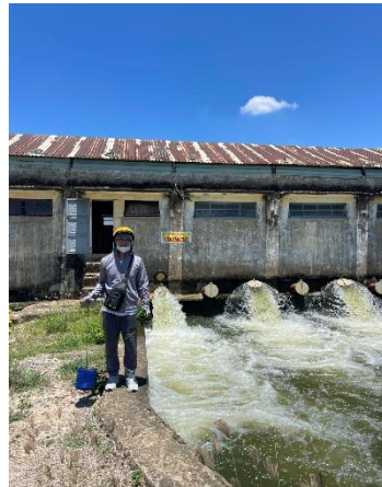
Hình 5. Trạm bơm Tứ Câu