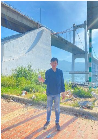
Hình 1. Cầu Thuận Phước

Một số hình ảnh lấy mẫu hiện trường ngày 12/07/2023 tại các vị trí quan trắc: