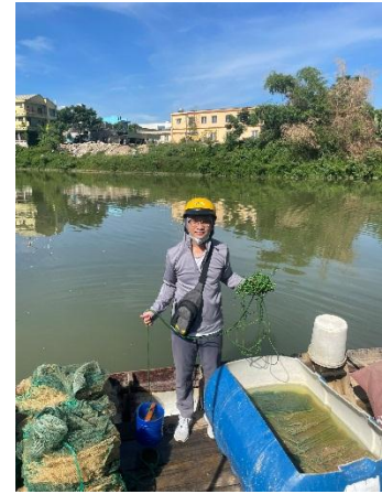
Hình 3. Trạm bơm Túy Loan