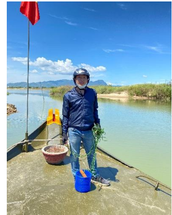
Hình 6. Vòm Cắm Đồng