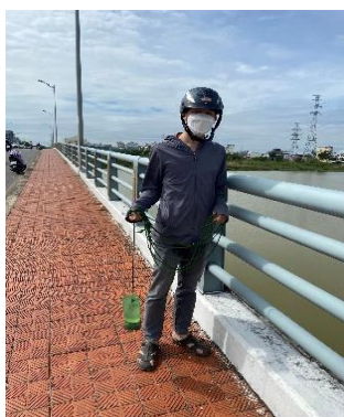
Hình 2: Cầu Hoà Xuân