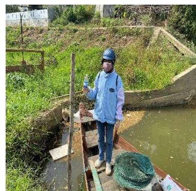
Hình 3: Trạm bơm Túy Loan