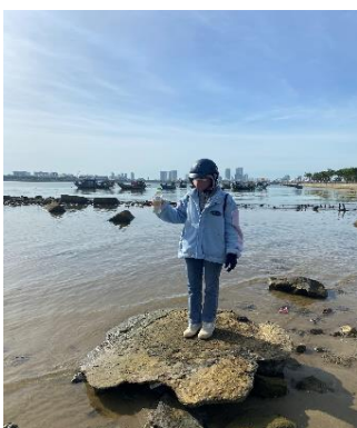
Hình 1: Cầu Thuận Phước

Một số hình ảnh lấy mẫu hiện trường ngày 13/7/2022 tại các vị trí quan trắc: