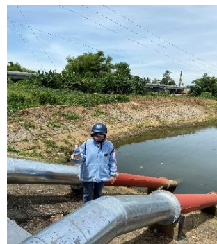
Hình 5: Trạm bơm Tứ Cầu