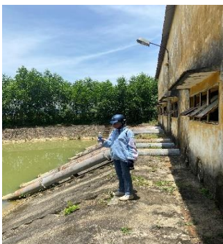
Hình 4: Trạm bơm Bích Bắc