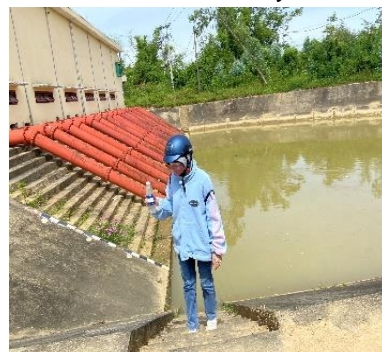
Hình 6: Trạm bơm Đông Quang