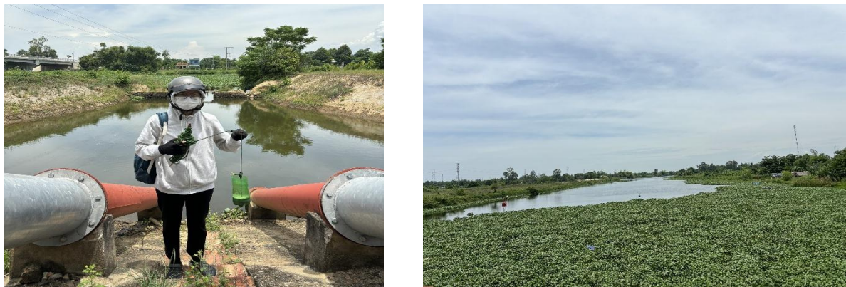
Hình 8. Mặt nước sông Vĩnh Điện tại khu vực Trạm bơm Tứ Câu bị bao phủ kín bởi bèo lục bình ngày 03/07/2024