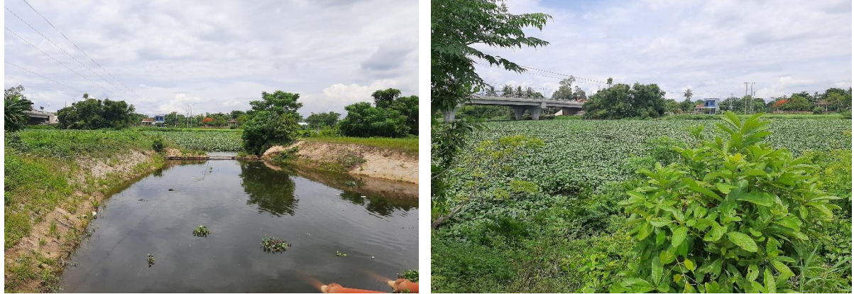
Hình 7. Mặt nước sông Vĩnh Điện tại khu vực Trạm bơm Tứ Câu bị bao phủ kín bởi bèo lục bình ngày 26/6/2024

Ngoài ra, tại thời điểm quan trắc nguồn nước sông Vĩnh Điện tại khu vực trạm bơm Tứ Câu vẫn tiếp tục bị bao phủ kín bởi bèo lục bình như tuần trước.