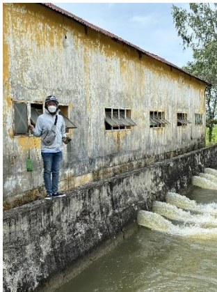
Hình 4. Trạm bơm Bích Bắc