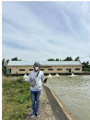
Hình 5. Trạm bơm Đồng Quang