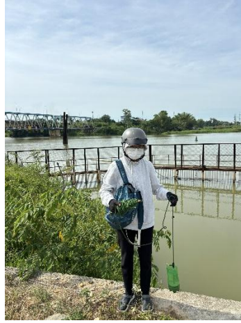
Hình 2. Thượng lưu Nhà máy nước Cầu Đỏ