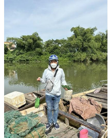
Hình 3. Trạm bơm Túy Loan