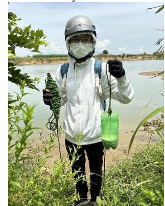
Hình 6. Vòm Cắm Đồng