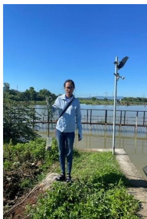
Hình 2. Cầu Đỏ