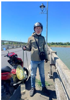
Hình 5. Cầu Câu Lâu