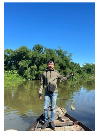
Hình 3. Trạm bơm Túy Loan