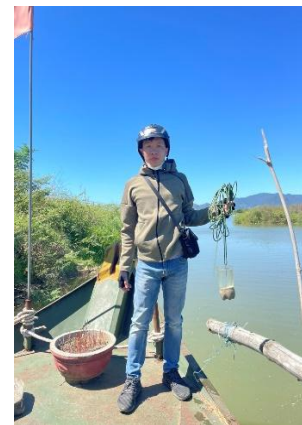
Hình 6. Vòm Cẩm Đông