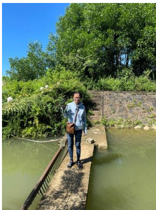
Hình 4. Trạm bơm Bích Bắc