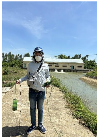
Hình 5. Trạm bơm Đông Quang