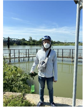
Hình 3. Thượng lưu Nhà máy nước Cầu Đỏ