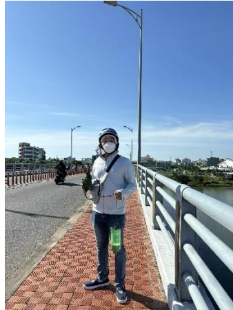
Hình 2. Cầu Hòa Xuân