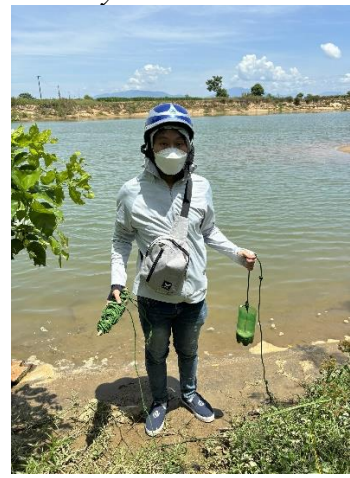
Hình 6. Vòm Cẩm Đồng