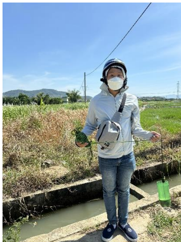
Hình 4. Trạm bơm Miếu Ông