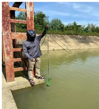
Hình 5: Trạm bơm Đông Quang