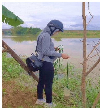
Hình 4: Trạm bơm Miếu Ông