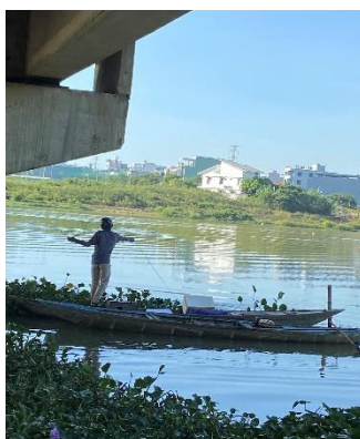
Hình 2: Cầu Hoà Xuân