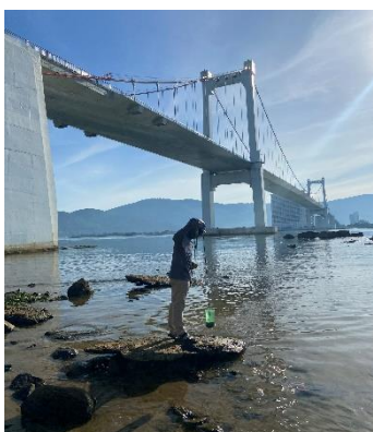
Hình 1: Cầu Thuận Phước

Một số hình ảnh lấy mẫu hiện trường ngày 30/6/2022 tại các vị trí quan trắc: