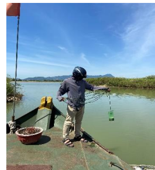
Hình 6: Vòm Cẩm Đông