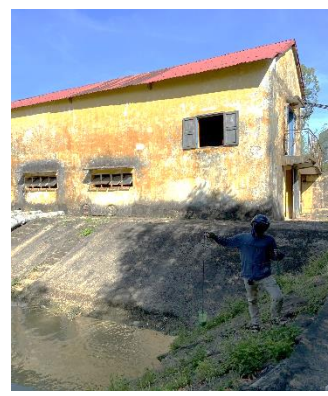
Hình 3: Trạm bơm Bích Bắc