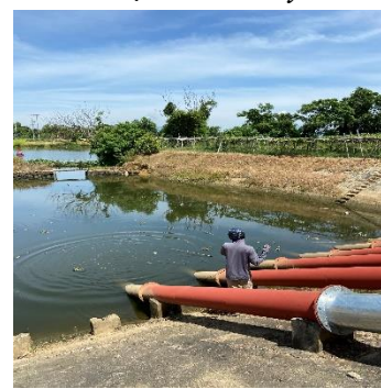
Hình 6: Trạm bơm Miếu Ông