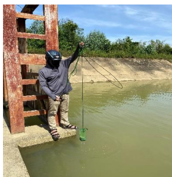
Hình 4: Trạm bơm Đông Quang