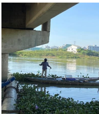
Hình 1: Cầu Hoà Xuân

Một số hình ảnh lấy mẫu hiện trường ngày 22/6/2022 tại các vị trí quan trắc: