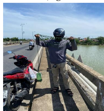
Hình 5: Cầu Câu Lâu