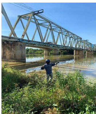
Hình 2: Thượng lưu Cầu Đỏ