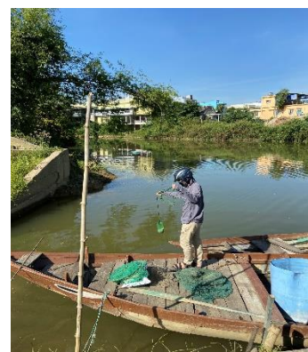
Hình 3: Trạm bơm Túy Loan