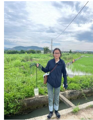
Hình 3. Trạm bơm Miếu Ông