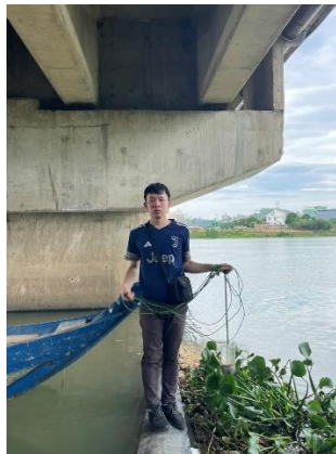
Hình 2. Cầu Hòa Xuân