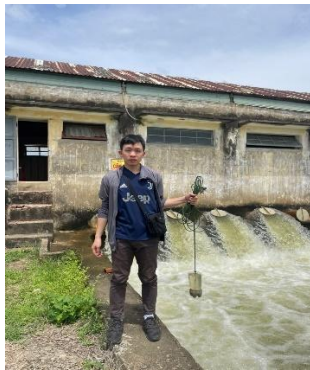
Hình 5. Trạm bơm Tứ Cầu