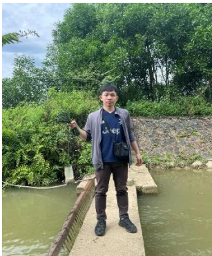
Hình 4. Trạm bơm Bích Bắc