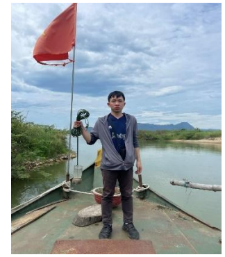
Hình 6. Vòm Cẩm Đồng