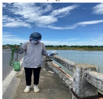
Hình 5: Cầu Câu Lâu