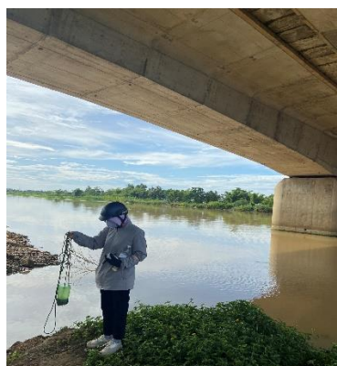
Hình 2: Thượng lưu Cầu Đỏ