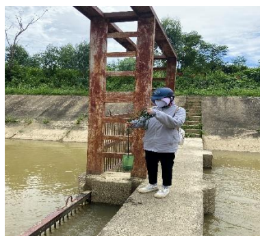
Hình 4: Trạm bơm Đông Quang