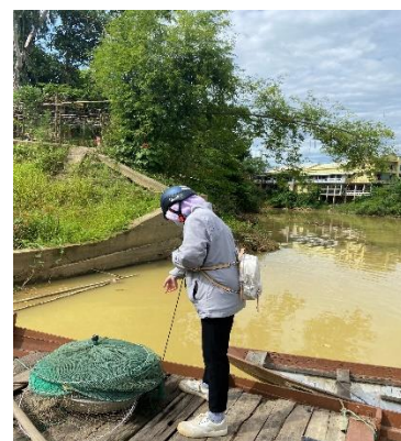
Hình 3: Trạm bơm Túy Loan