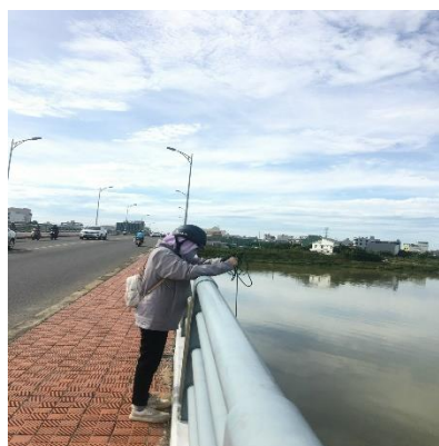
Hình 1: Cầu Hoà Xuân

Một số hình ảnh lấy mẫu hiện trường ngày 15/6/2022 tại các vị trí quan trắc: