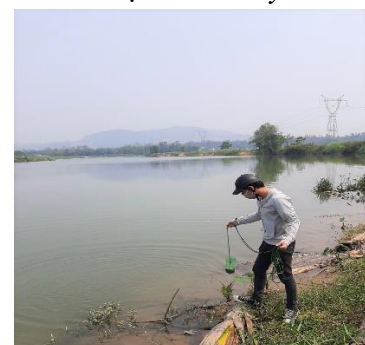
Hình 6: Trạm bơm Miếu Ông