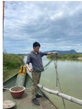
Hình 5. Vòm Cắm Đòng