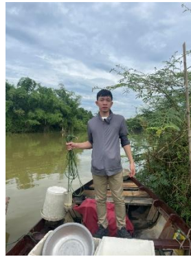
Hình 2. Trạm bơm Tuý Loan