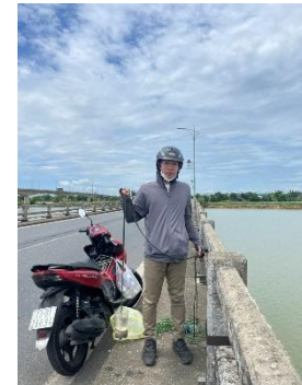
Hình 6. Cầu Câu Lâu