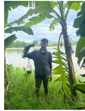
Hình 3. Trạm bơm Miếu Ông