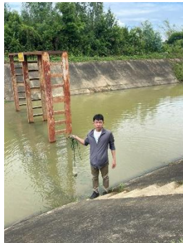
Hình 4. Trạm bơm Đông Quang