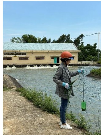
Hình 5. Trạm bơm Đông Quang