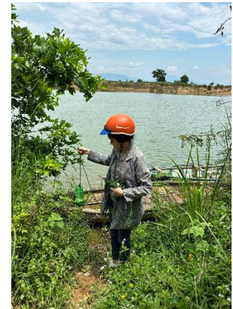
Hình 6. Vòm Cẩm Đồng