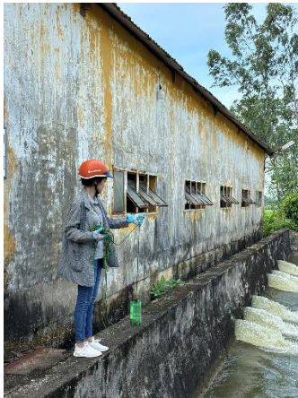
Hình 4. Trạm bơm Bích Bắc