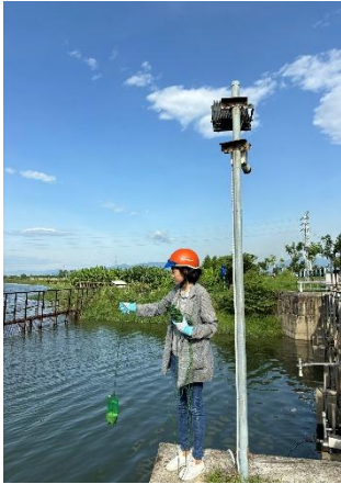
Hình 1. Cầu Đỏ

Một số hình ảnh lấy mẫu hiện trường ngày 05/06/2024 tại các vị trí quan trắc: