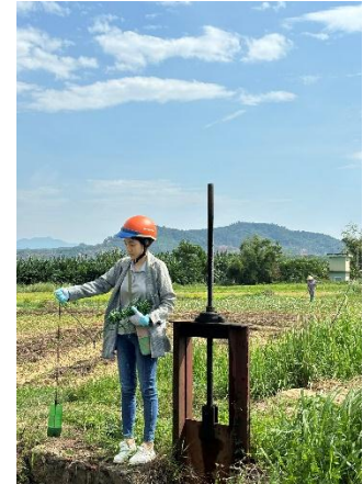
Hình 3. Trạm Bơm Miếu Ông