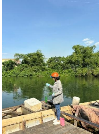
Hình 2. Trạm bơm Túy Loan