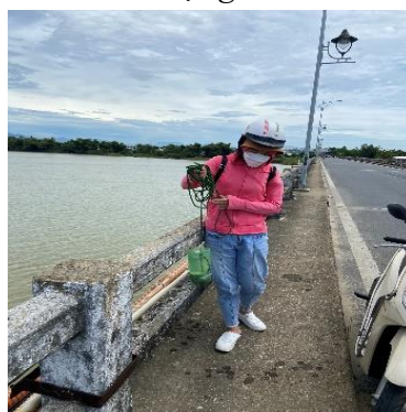
Hình 5: Cầu Câu Lâu