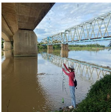
Hình 2: Thượng lưu Cầu Đỏ