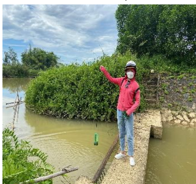
Hình 4: Trạm bơm Bích Bắc