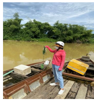
Hình 3: Trạm bơm Túy Loan