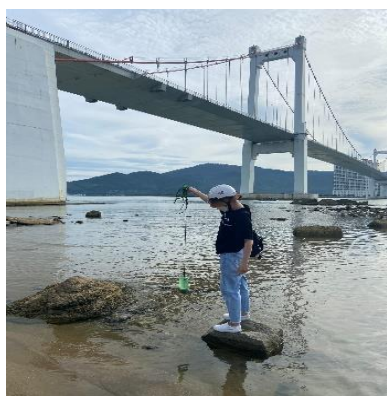
Hình 1: Cầu Thuận Phước

Một số hình ảnh lấy mẫu hiện trường ngày 8/6/2022 tại các vị trí quan trắc: