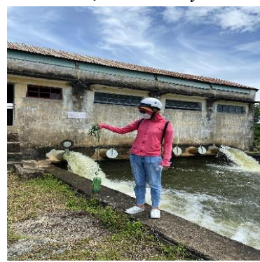
Hình 6: Trạm bơm Từ Cầu