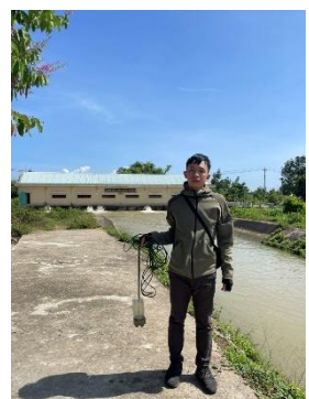
Hình 4. Trạm bơm Đông Quang