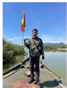
Hình 5. Vòm Cẩm Đông