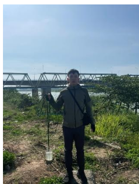
Hình 1. Cầu Đỏ

Một số hình ảnh lấy mẫu hiện trường ngày 31/5/2023 tại các vị trí quan trắc: