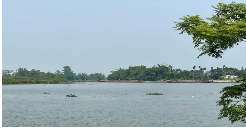
Hình 7. Công trình đập tạm Tứ Câu đã hoàn thiện