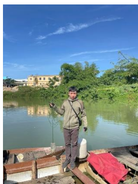
Hình 2. Trạm bơm Tuý Loan