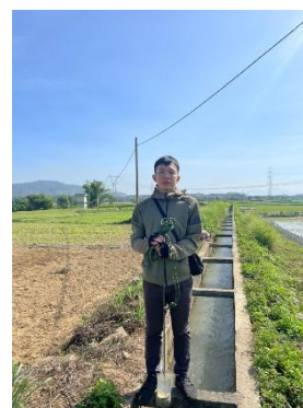
Hình 3. Trạm bơm Miếu Ông