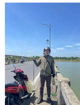
Hình 6. Cầu Câu Lâu