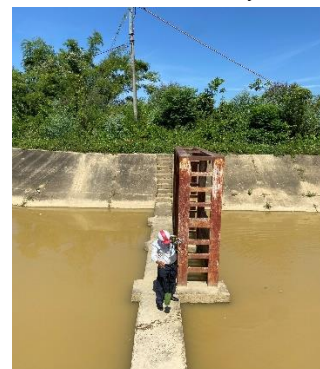
Hình 6: Trạm bơm Đông Quang