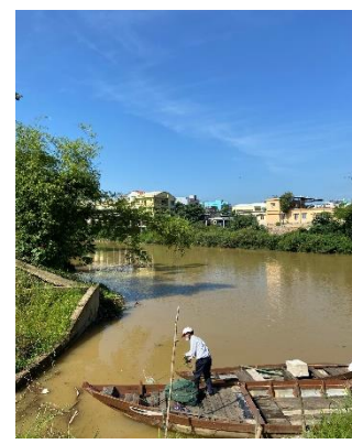
Hình 3: Trạm bơm Túy Loan