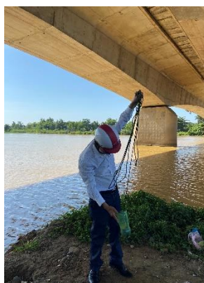
Hình 2: Thượng lưu Cầu Đỏ