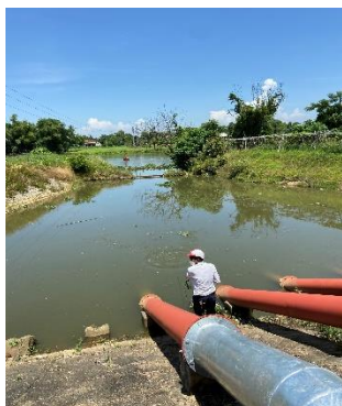
Hình 4: Trạm bơm Tứ Cầu