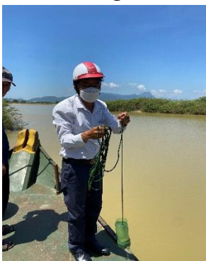
Hình 5: Vòm Cắm Đòng