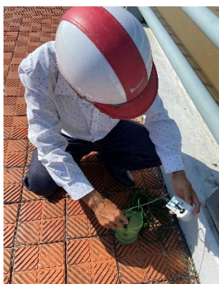
Hình 1: Cầu Hoà Xuân

Một số hình ảnh lấy mẫu hiện trường ngày 01/6/2022 tại các vị trí quan trắc: