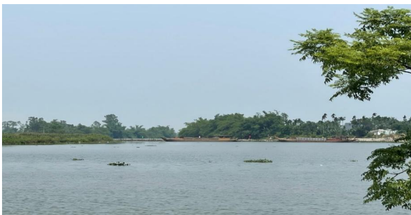
Hình 7. Công trình đập tạm Tứ Câu đã hoàn thiện