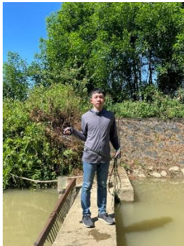
Hình 4. Trạm bơm Bích Bắc