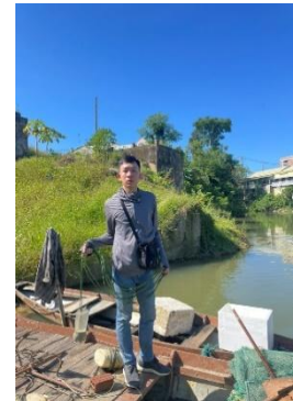
Hình 3. Trạm bơm Túy Loan