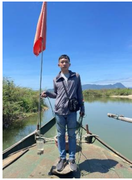
Hình 5. Vòm Cẩm Đông