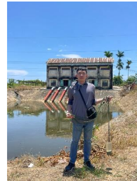
Hình 6. Trạm bơm Từ Cầu