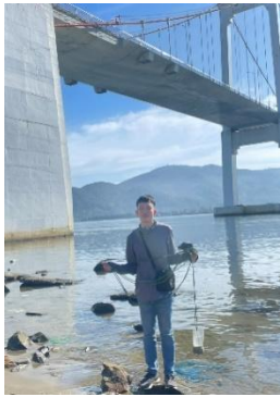
Hình 1. Cầu Thuận Phước

Một số hình ảnh lấy mẫu hiện trường ngày 25/5/2023 tại các vị trí quan trắc: