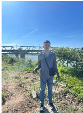
Hình 2. Cầu Đỏ