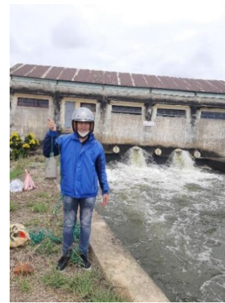
Hình 6. Trạm bơm Từ Cầu