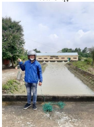
Hình 5. Trạm bơm Đông Quang