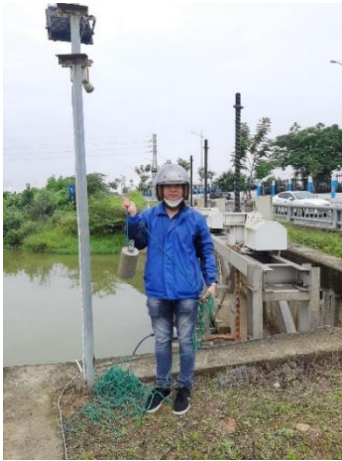
Hình 1. Thượng lưu nhà máy nước Cầu Đỏ

Một số hình ảnh lấy mẫu hiện trường ngày 22/05/2024 tại các vị trí quan trắc: