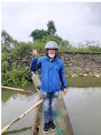
Hình 4. Trạm bơm Bích Bắc