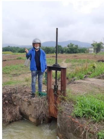
Hình 2. Trạm bơm Miếu Ông