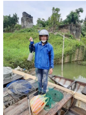
Hình 3. Trạm bơm Túy Loan