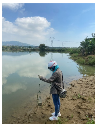
Hình 2: Trạm bơm Miếu Ông