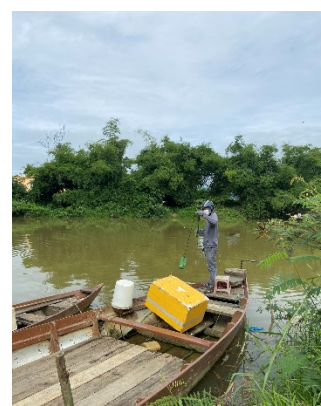
Hình 3: Trạm bơm Túy Loan