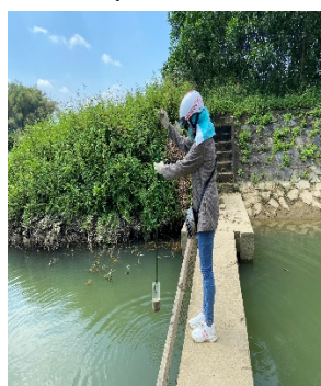
Hình 5: Trạm bơm Bích Bắc