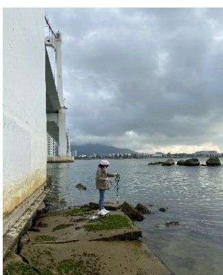
Hình 1: Cầu Thuận Phước

Một số hình ảnh lấy mẫu hiện trường ngày 25/5/2022 tại các vị trí quan trắc: