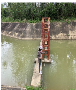
Hình 4: Trạm bơm Đông Quang