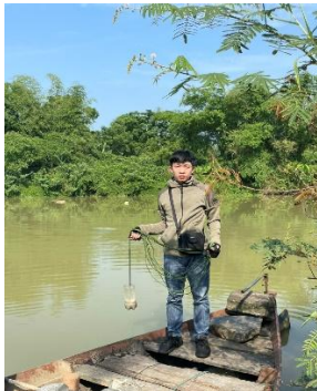
Hình 4. Trạm bơm Túy Loan