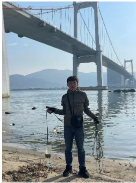
Hình 1. Cầu Thuận Phước

Một số hình ảnh lấy mẫu hiện trường ngày 17/5/2023 tại các vị trí quan trắc: