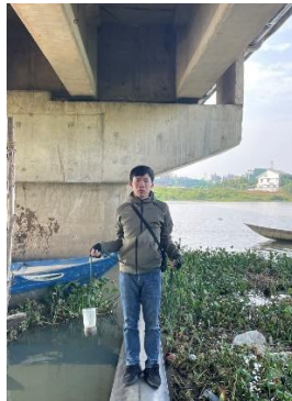
Hình 2. Cầu Hoà Xuân