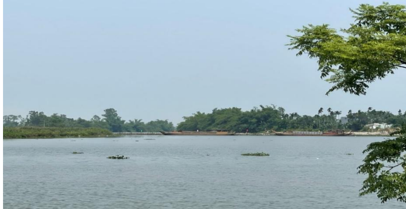
Hình 7. Công trình đập tạm Tứ Câu đã hoàn thiện