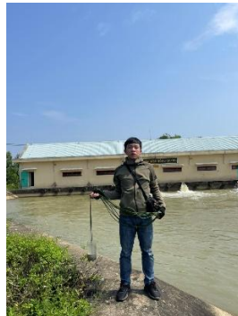
Hình 5. Trạm bơm Đông Quang