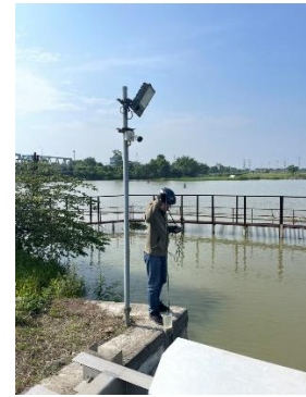
Hình 3. Cầu Đỏ