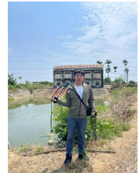
Hình 6. Trạm bơm Tứ Cầu