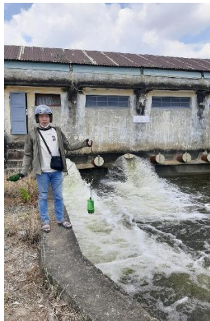
Hình 5. Trạm bơm Tứ Câu