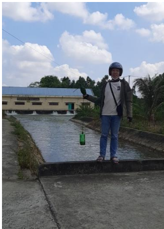
Hình 4. Trạm bơm Đông Quang