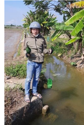
Hình 3. Trạm bơm Miếu Ông