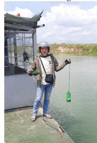
Hình 6. Vòm Cắm Đồng