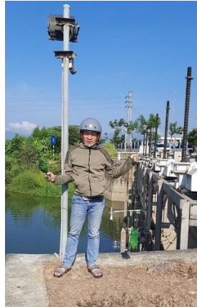
Hình 2. Thương lưu nhà máy nước Cầu Đỏ