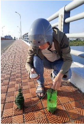
Hình 1. Cầu Hòa Xuân

Một số hình ảnh lấy mẫu hiện trường ngày 15/05/2024 tại các vị trí quan trắc: