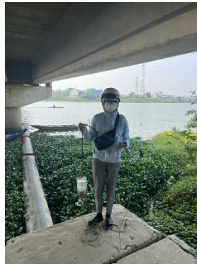
Hình 2. Cầu Hòa Xuân