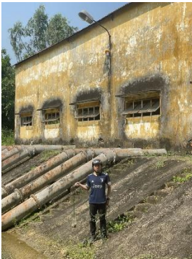
Hình 3. Trạm bơm Bích Bắc