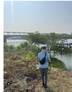
Hình 3. Cầu Đỏ