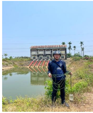
Hình 5. Trạm bơm Từ Câu