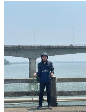
Hình 6. Cầu Câu Lâu