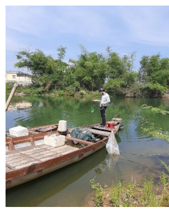
Hình 3: Trạm bơm Tuý Loan