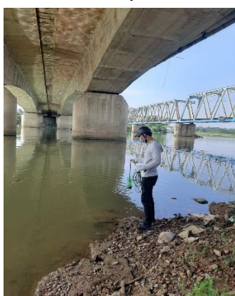
Hình 1: Thượng lưu Cầu Đỏ

Một số hình ảnh lấy mẫu hiện trường ngày 11/5/2022 tại các vị trí quan trắc: