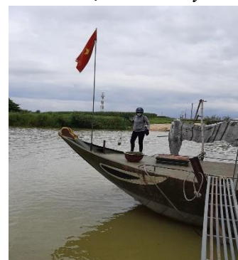
Hình 6: Vòm Cẩm Đồng