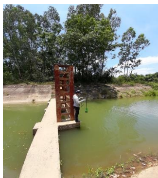
Hình 5: Trạm bơm Đồng Quang