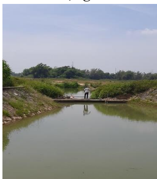
Hình 4: Trạm bơm Bích Bắc