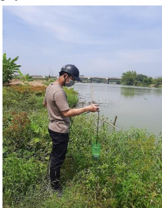
Hình 2: Cầu Hoà Xuân