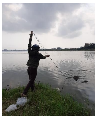
Hình 2: Cầu Hoà Xuân