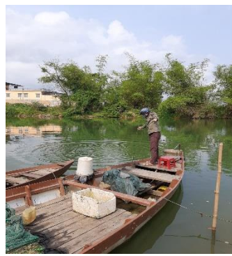
Hình 5: Trạm bơm Túy Loan