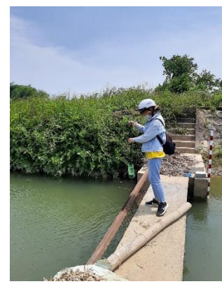
Hình 3: Trạm bơm Bích Bắc