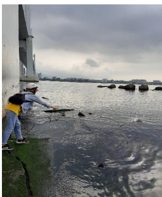
Hình 1: Cầu Thuận Phước

Một số hình ảnh lấy mẫu hiện trường ngày 4/5/2022 tại các vị trí quan trắc: