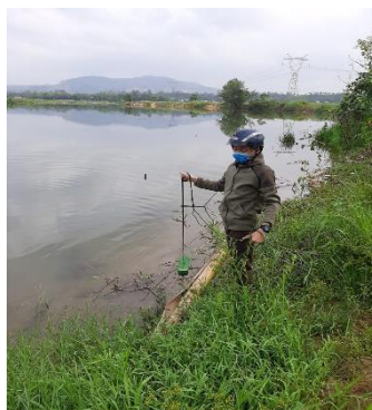
Hình 4: Trạm bơm Miếu Ông