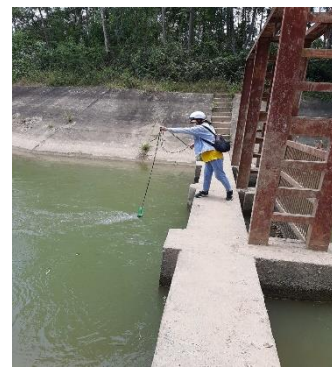
Hình 6: Trạm bơm Đồng Quang