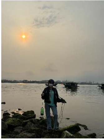
Hình 1. Cầu Thuận Phước

Một số hình ảnh lấy mẫu hiện trường ngày 24/04/2024 tại các vị trí quan trắc: