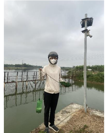
Hình 3. Thượng lưu NMN Cầu Đỏ