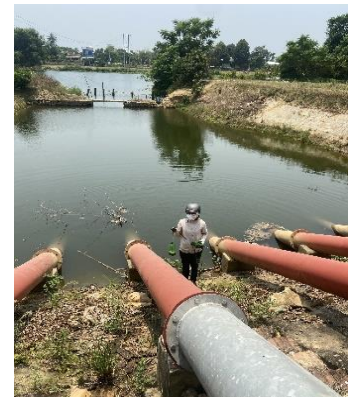
Hình 6. Trạm bơm Từ Cầu