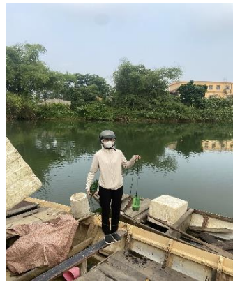
Hình 4. Trạm bơm Tuý Loan