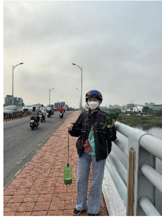
Hình 2. Cầu Hoà Xuân