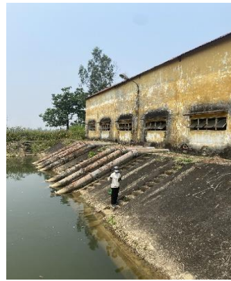
Hình 5. Trạm bơm Bích Bắc