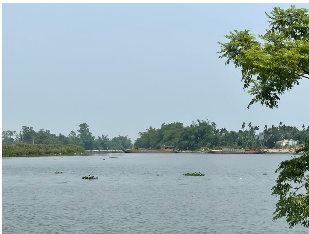
Hình 7. Công trình đập tạm Tứ Câu đã hoàn thiện