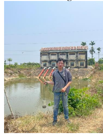
Hình 6. Trạm bơm Tír Cầu