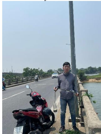
Hình 5. Cầu Câu Lâu