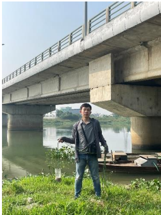
Hình 1. Cầu Hòa Xuân

Một số hình ảnh lấy mẫu hiện trường ngày 19/4/2023 tại các vị trí quan trắc: