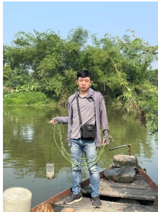
Hình 2. Trạm bơm Tuý Loan