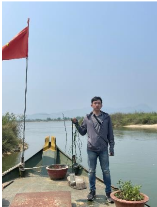
Hình 4. Vòm Cẩm Đồng