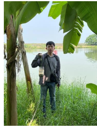
Hình 3. Trạm bơm Miếu Ông