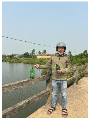
Hình 5. Trạm bơm Bích Bắc