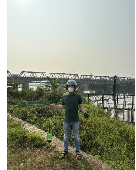
Hình 3. Thượng lưu NMN Cầu Đỏ