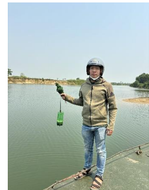
Hình 6. Vòm Cẩm Đồng