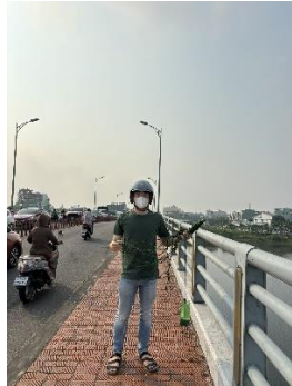
Hình 2. Cầu Hoà Xuân