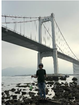
Hình 1. Cầu Thuận Phước

Một số hình ảnh lấy mẫu hiện trường ngày 17/04/2024 tại các vị trí quan trắc: