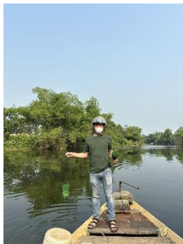
Hình 4. Trạm bơm Tuý Loan