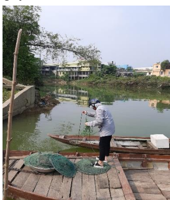
Hình 2: Trạm bơm Túy Loan