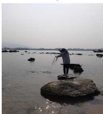
Hình 1: Cầu Thuận Phước

Một số hình ảnh lấy mẫu hiện trường ngày 20/4/2022 tại các vị trí quan trắc: