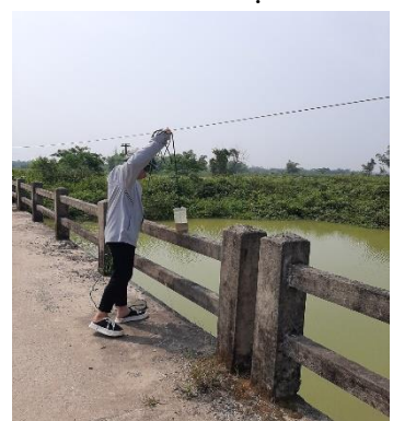
Hình 4: Trạm bơm Bích Bắc