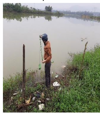
Hình 6: Trạm bơm Miếu Ông