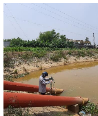
Hình 3: Trạm bơm Tứ Cầu