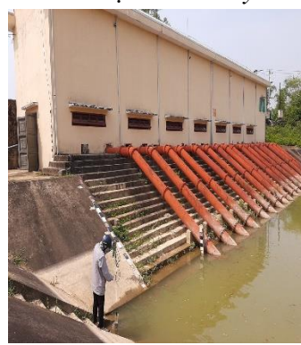
Hình 5: Trạm bơm Đông Quang