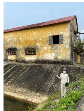
Hình 3. Trạm bơm Bích Bắc