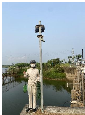
Hình 2. Thượng lưu NMN Cầu Đỏ