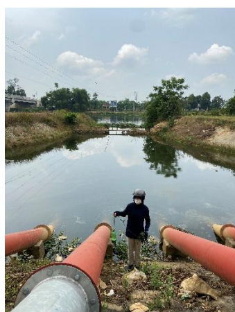
Hình 4. Trạm bơm Tứ Cầu