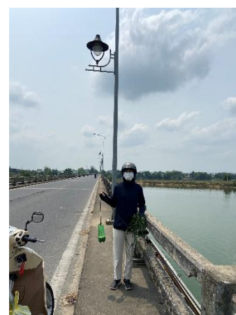
Hình 6. Cầu Câu Lâu