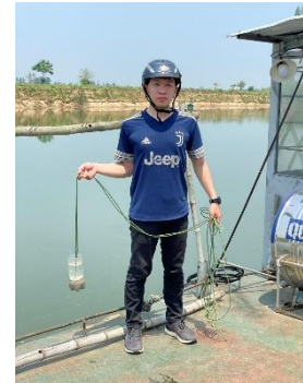
Hình 6. Vòm Cắm Đông