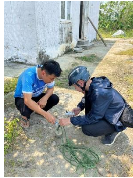
Hình 5. Trạm bơm Tứ Câu