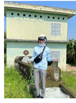
Hình 3. Trạm bơm Miếu Ông