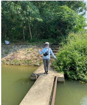
Hình 3. Trạm bơm Bích Bắc