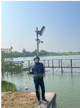
Hình 1. Cầu Đò

Một số hình ảnh lấy mẫu hiện trường ngày 05/4/2023 tại các vị trí quan trắc: