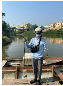
Hình 2. Trạm bơm Túy Loan