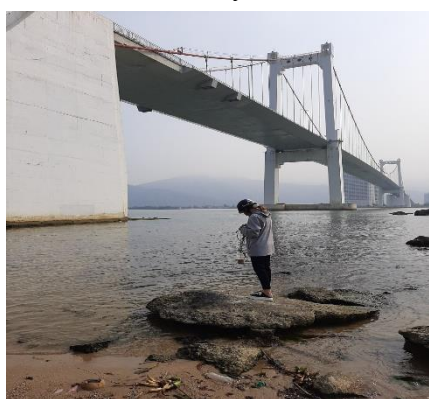
Hình 1: Cầu Thuận Phước

Một số hình ảnh lấy mẫu hiện trường ngày 14/4/2022 tại các vị trí quan trắc: