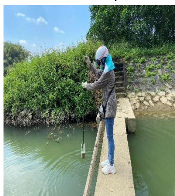
Hình 4: Trạm bơm Bích Bắc