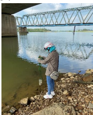
Hình 2: Cầu Đỏ