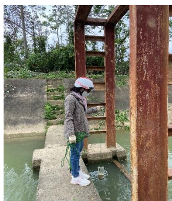
Hình 5: Trạm bơm Đồng Quang