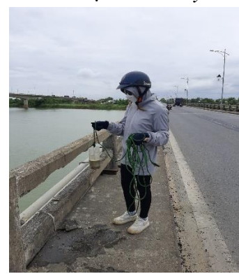
Hình 6: Cầu Câu Lâu