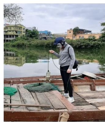
Hình 3: Trạm bơm Tuý Loan