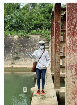
Hình 3. Trạm bơm Đông Quang