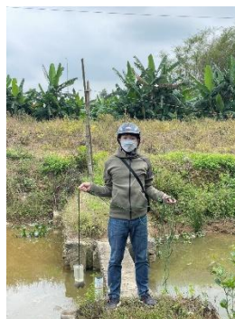
Hình 3. Trạm bơm Tứ Cầu