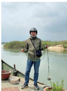
Hình 5. Vòm Cẩm Đồng