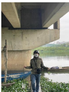
Hình 1. Cầu Hoà Xuân

Một số hình ảnh lấy mẫu hiện trường ngày 29/3/2023 tại các vị trí quan trắc: