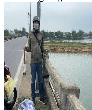
Hình 6. Cầu Câu Lâu