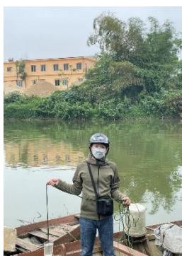
Hình 2. Trạm bơm Túy Loan