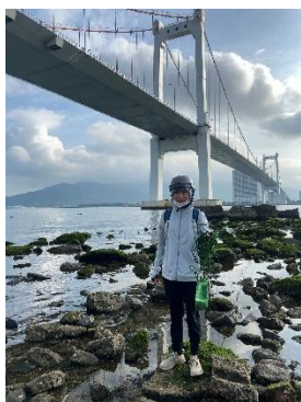
Hình 1. Cầu Thuận Phước

Một số hình ảnh lấy mẫu hiện trường ngày 27/03/2024 tại các vị trí quan trắc: