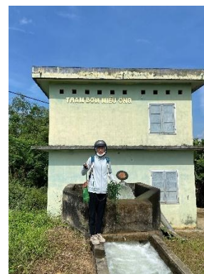
Hình 3. Trạm bơm Miếu Ông