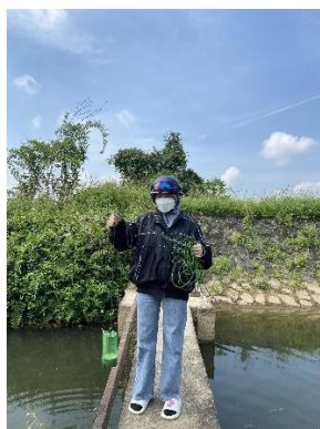
Hình 4. Trạm bơm Bích Bắc