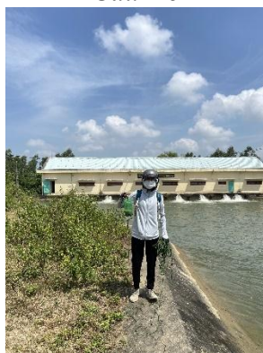
Hình 5. Trạm bơm Đông Quang