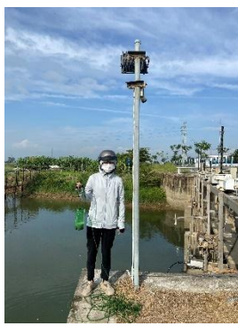
Hình 2. Thượng lưu NMN Cầu Đỏ