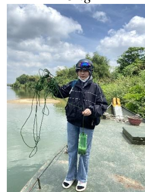
Hình 6. Vòm Cẩm Đồng