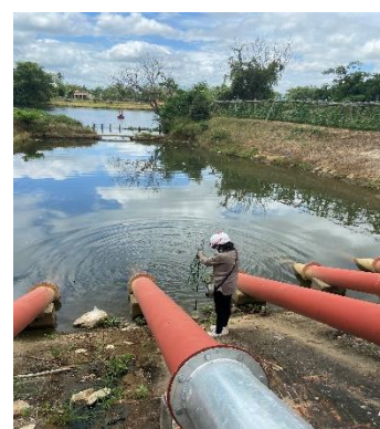
Hình 3: Trạm bơm Tứ Cầu