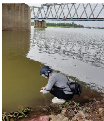
Hình 2: Thượng lưu Cầu Đỏ