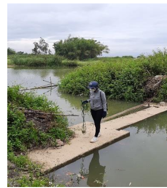
Hình 6: Trạm bơm Bích Bắc