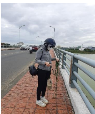
Hình 1: Cầu Hoà Xuân

Một số hình ảnh lấy mẫu hiện trường ngày 30/3/2022 tại các vị trí quan trắc: