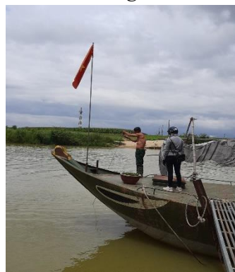
Hình 5: Vòm Cẩm Đồng