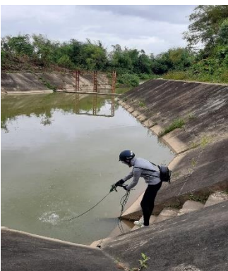
Hình 4: Trạm bơm Đồng Quang