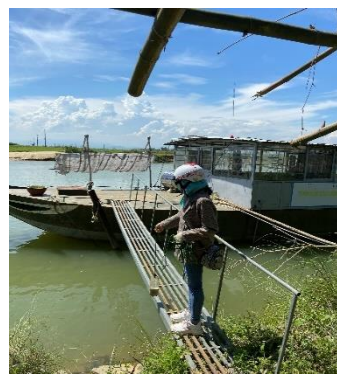
Hình 5: Vòm Cẩm Đồng