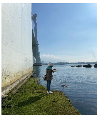
Hình 1: Cầu Thuận Phước

Một số hình ảnh lấy mẫu hiện trường ngày 16/3/2022 tại các vị trí quan trắc: