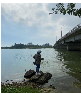
Hình 2: Cầu Hoà Xuân