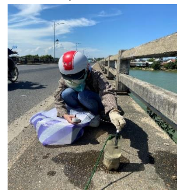
Hình 6: Cầu Câu Lâu