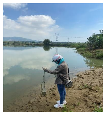
Hình 3: Trạm bơm Miếu Ông