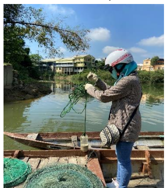
Hình 4: Trạm bơm Túy Loan