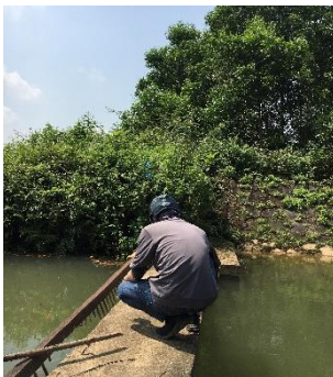
Hình 4. Trạm bơm Bích Bắc