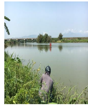
Hình 3: Trạm bơm Miếu Ông