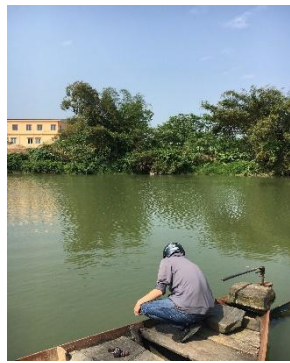
Hình 2: Trạm bơm Túy Loan