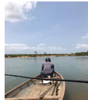
Hình 6: Vòm Cẩm Đồng