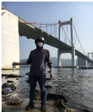
Hình 1: Cầu Thuận Phước

Một số hình ảnh lấy mẫu hiện trường ngày 15/3/2023 tại các vị trí quan trắc: