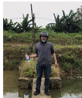
Hình 5. Trạm bơm Tứ Cầu