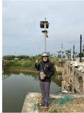
Hình 2. Thượng lưu NMN Cầu Đỏ