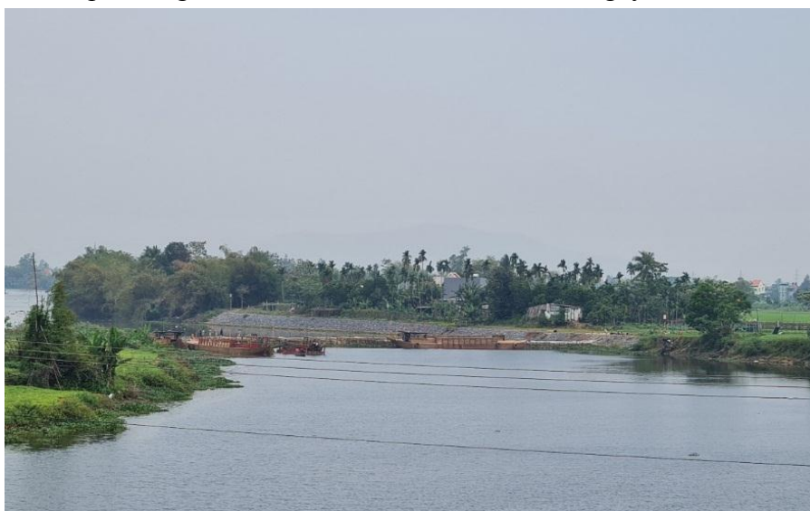
Hình 7. Công trình đập tạm Tứ Câu đã hoàn thiện

Tại khu vực nghiên cứu có hệ thống các đập dâng An Trạch, Hà Thanh, Bàu Nít, Thanh Quýt và đập ngăn mặn Duy Thành đã được xây dựng kiên cố. Ngoài ra, trên sông Quảng Huế, năm 2021 đã tiến hành xây dựng 01 đập tạm dâng nước trên sông, tuy nhiên đập tạm đã bị xói lở nhiều sau trận mưa lũ lớn năm 2022 chưa được nâng cấp, sửa chữa. Trên nhánh sông Vĩnh Điện, công trình đập tạm ngăn mặn Tứ Câu đã hoàn thiện vào ngày 06/3/2024.