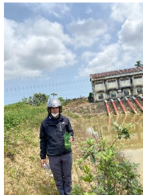
Hình 5. Trạm bơm Tứ Cầu