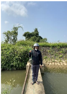
Hình 4. Trạm bơm Bích Bắc