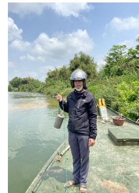
Hình 6. Vòm Cẩm Đồng