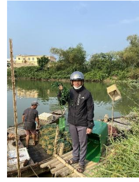
Hình 3. Trạm bơm Túy Loan