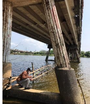
Hình 5. Cầu Câu Lâu