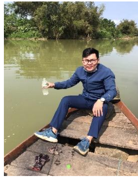
Hình 2: Trạm bơm Túy Loan