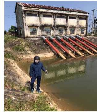
Hình 3: Trạm bơm Tứ Cầu