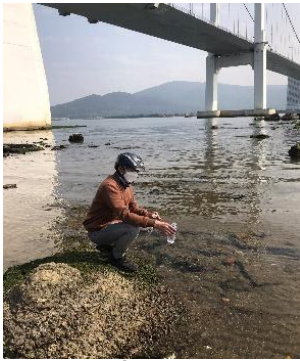
Hình 1: Cầu Thuận Phước

Một số hình ảnh lấy mẫu hiện trường ngày 08/3/2023 tại các vị trí quan trắc: