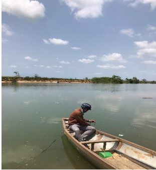
Hình 4. Vòm Cắm Đồng