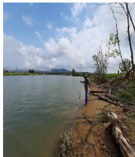
Hình 2: Trạm bơm Miếu Ông