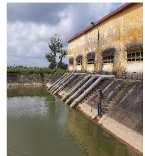
Hình 4: Trạm bơm Bích Bắc