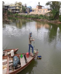
Hình 3: Trạm bơm Tuý Loan