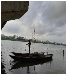
Hình 1: Cầu Hoà Xuân

Một số hình ảnh lấy mẫu hiện trường ngày 02/3/2023 tại các vị trí quan trắc: