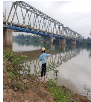
Hình 4: Thượng lưu Cầu Đỏ