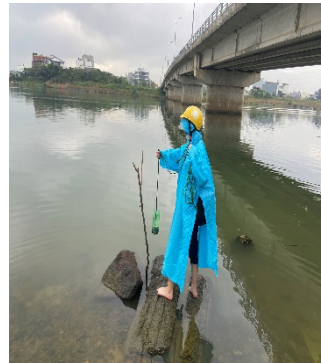
Hình 2: Cầu Hoà Xuân