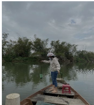
Hình 3: Trạm bơm Túy Loan