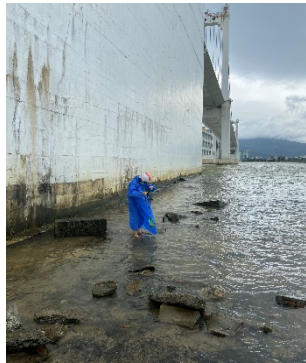
Hình 1: Cầu Thuận Phước

Một số hình ảnh lấy mẫu hiện trường ngày 22/02/2023 tại các vị trí quan trắc: