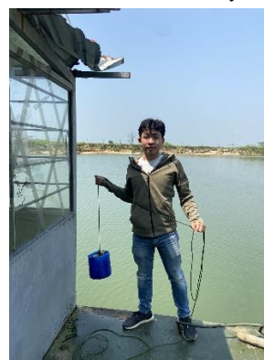
Hình 6. Vòm Cẩm Đồng