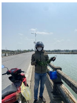
Hình 5. Cầu Câu Lâu