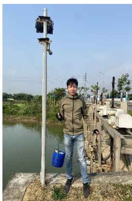
Hình 2. Cầu Đò