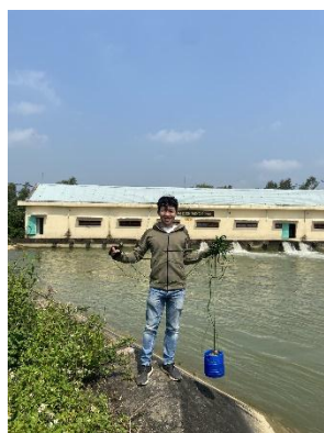
Hình 4. Trạm bơm Đông Quang