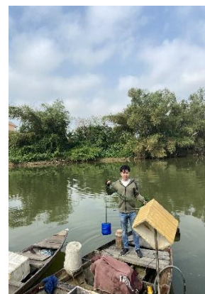
Hình 3. Trạm bơm Túy Loan