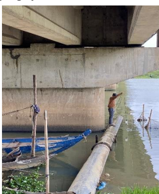
Hình 2: Cầu Hoà Xuân