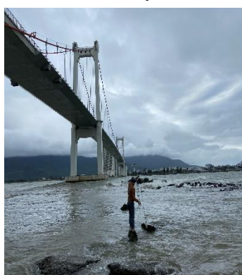
Hình 1: Cầu Thuận Phước

Một số hình ảnh lấy mẫu hiện trường ngày 23/02/2022 tại các vị trí quan trắc: