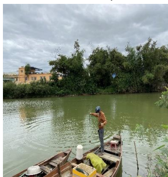
Hình 4: Trạm bơm Tuý Loan