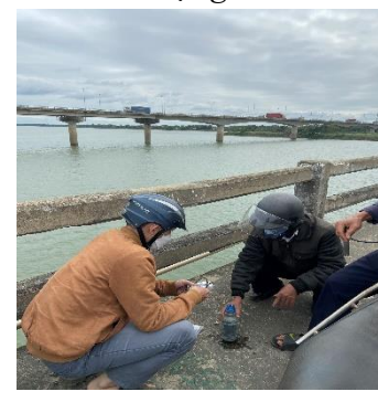
Hình 6: Cầu Câu Lâu