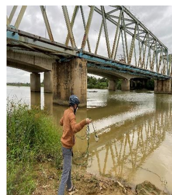
Hình 3: Thượng lưu Cầu Đỏ