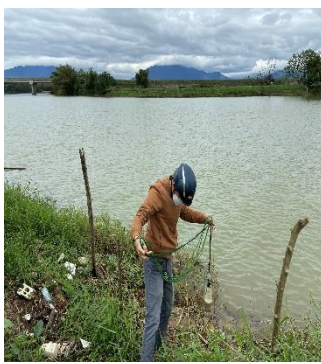
Hình 5: Trạm bơm Miếu Ông